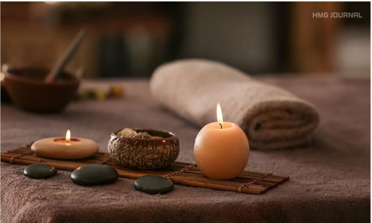
Aroma Terapi yang menyegarkan