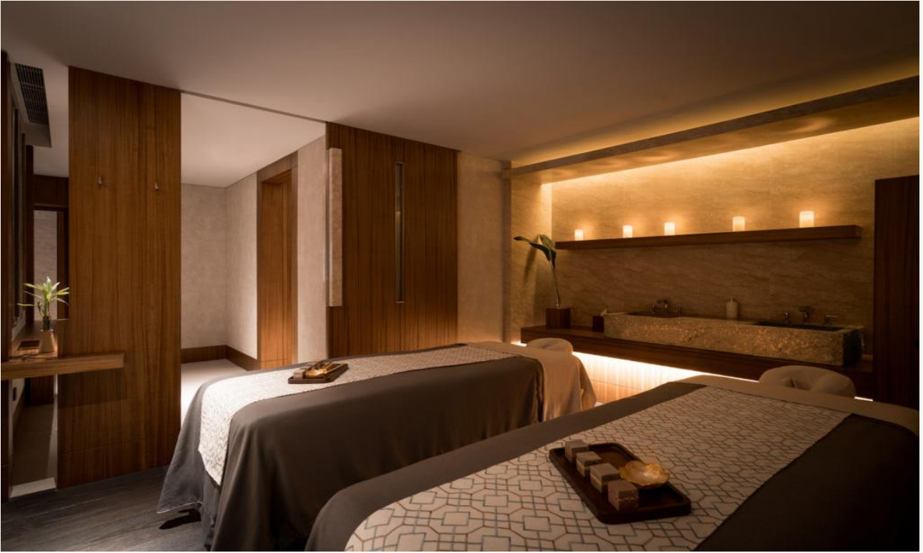
Bilik Spa yang bersih dan selesa